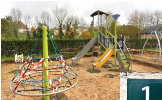
Aire de jeux installée au foirail