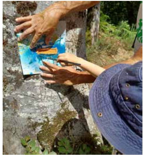
Chemin de la zone humide