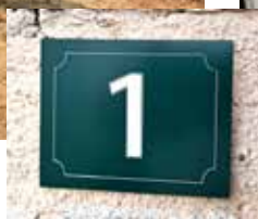
Réalisation de la numérotation