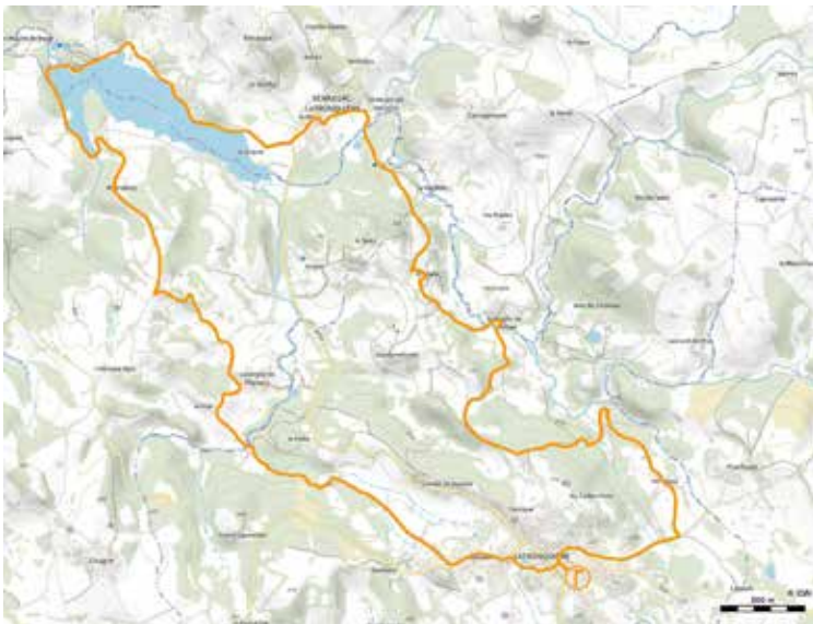
Chemin des Trois-pierres