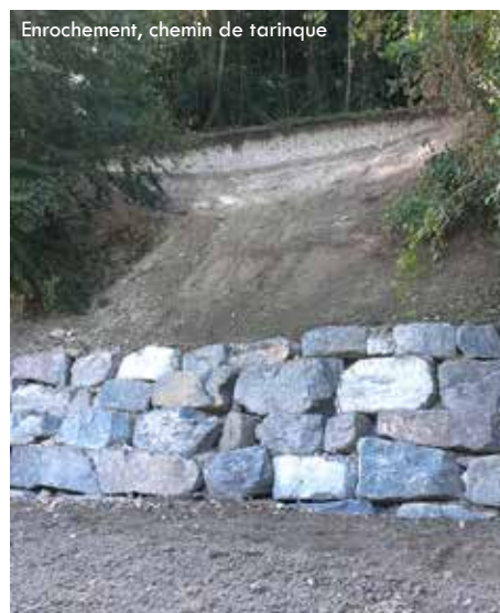
Enrochement, chemin de tarinque