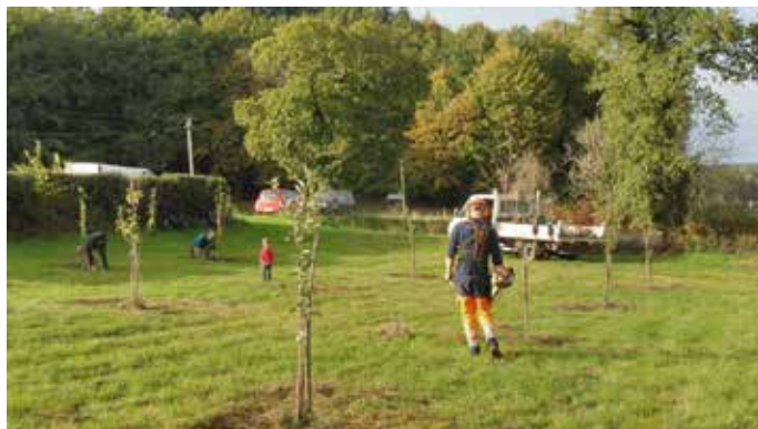
Chantier citoyen : suppression des embases plastiques par du broyat de bois