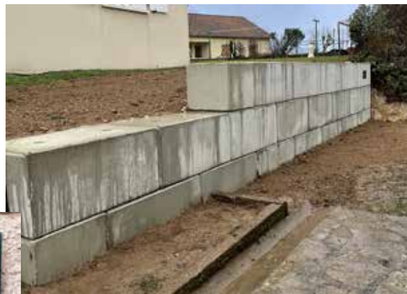
Construction d'un mur de soutènement, maison de la commune