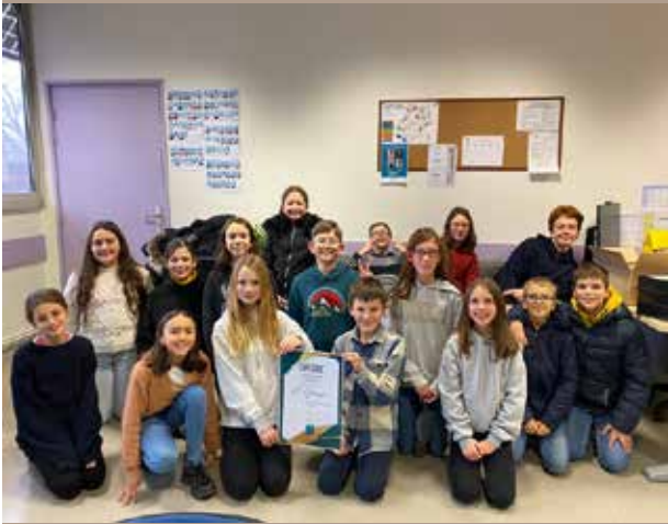
Les gagnants du concours de recyclage 601 Groupe 1 tenant leur diplôme

Cette année les éco-délégués ont pu mettre en place un concours de recyclage. Le principe ? Ramener par classe le plus de kilos de matériel pour les divers programmes de recyclage mis en place au sein du collège tels que les piles, les stylos, les bouchons, les brosses à dents, tubes de dentifrice et cartouches d'imprimantes. Tous les élèves du collège ont vaillamment participé à cette action comme le montre le résultat de chaque classe :