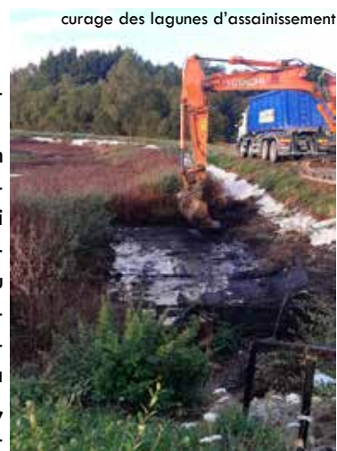
curage des lagunes d'assainissement

L'étude sera présentée fin janvier aux élus. La commune bénéficiera ainsi d'outils d'aide à la décision pour dimensionner au mieux ses ouvrages et proposer la filière de traitement la mieux adaptée à la future station. Toutefois, la réhabilitation nécessitera des travaux importants à mettre en place pour supprimer les dysfonctionnements et ainsi optimiser l'ouvrage qui recevra les eaux usées.