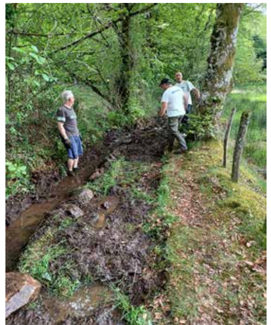
Chantier citoyen : restauration du chemin des trois-pierres en vue de la préparation de la rando VTT «La Tolermoise» 2022.

Nous prévoyons l'ouverture de la voie romaine, de Labastide-du-Haut-Mont jusqu'à Latronquière, ainsi que la peinture du mini golf.